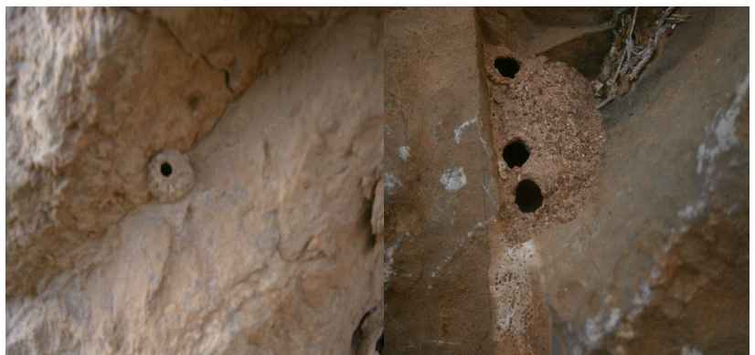
Photographies 4 et 5 : exemples de types d'habitats sous les pierres

Le principe est ici le même que pour les murs. Nous pouvons rajouter que dans ce cas les tunnels communiquent parfois vers un trou central et que l'abeille ferme les portes petit à petit ou peut laisser les ouvertures à l'air libre. À nouveau le type de terre utilisé varie en fonction du choix de l'abeille solitaire et du milieu environnant.