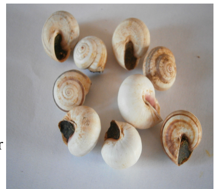
Photographie 5 : coquilles d'escargot utilisées par Bakenziz

Nous ne pouvons pas le voir sur la photographie 6 mais il y a également une « porte » de terre à l'intérieur de la coquille d'escargot qui délimite les compartiments propres à chaque larve. Certains enfants ont également mentionnés la présence contre les parois de ce qu'ils appellent « le chocolat ». Ce chocolat serait comme le miel mais d'une couleur marron.