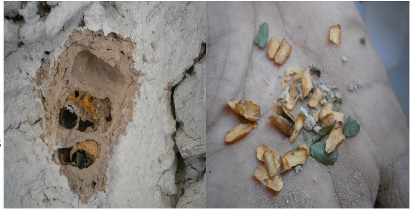
Photographies 3 et 4 : intérieur des tunnels construits à base de feuilles

Les parois des cellules peuvent être construites avec des fragments de feuilles ou uniquement avec de la terre. Les galeries peuvent être ouvertes ou fermées. Par exemple sur la photographie 2 nous ne voyons que deux tunnels alors qu'en creusant nous remarquons la présence d'un troisième tunnel qui a été refermé sans qu'il y ait accumulation de pollen.