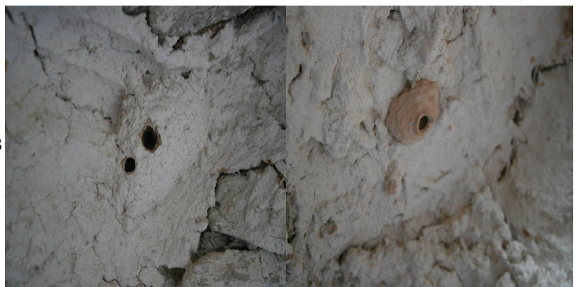
Photographies 2 et 3 : tunnels d'une abeille solitaire dans un mur au dessus d'une porte

Comme le montrent les photographies ci contre le nombre de tunnels peut varier ainsi que la qualité de la terre utilisée.