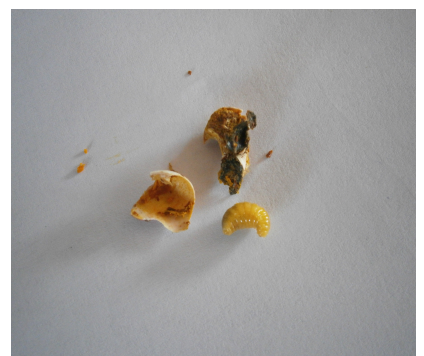
Photographie 6 : détails internes