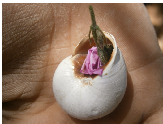
Photographie 7 : capture de bakenziz

Ils prennent ensuite Bakenziz par les ailes ou dans la main et l'enferment dans une coquille d'escargot dont l'ouverture est bloquée par une fleur pendant deux jours. Ils se sont rendus compte qu'après deux jours d'emprisonnement Bakenziz s'acclimate. Il va faire des aller retours dans la coquille pour y déposer son miel qu'ils n'auront plus qu'à consommer. Nous sommes face à un cas d'expérimentation qui a fonctionné.